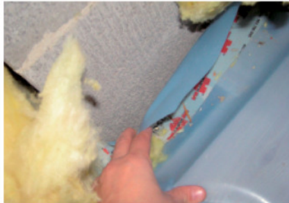
Leckage durch nicht fachgerecht ausgeführte Luftdichtung an einem Schornsteinanschluss.