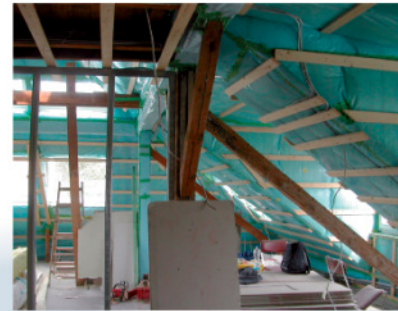
Die luftdichte Ebene ist noch sichtbar (Folie und Holzbauplatte): Der optimale Zeitpunkt für eine BlowerDoor-Messung

Nach Energieeinsparverordnung erfolgt die Luftdichtheitsmessung im Nutzungszustand des Gebäudes. Wir empfehlen eine zusätzliche BlowerDoor-Messung bereits zu dem Zeitpunkt, an dem die luftdichte Hülle noch sichtbar ist, denn dann können Leckagen gezielt und oft mit wenig Aufwand beseitigt werden. Erfolgt die Luftdichtheitsmessung ausschließlich im Nutzungszustand, sind Nachbesserungen in der Regel aufwändiger und mit wesentlich höheren Kosten verbunden.