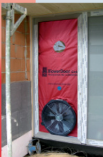
BlowerDoor-Messung eines neu gebauten Einfamilienhauses.

Der Glaube, ein Gebäude müsse Ritzen und Fugen haben, um „natürlich zu atmen“, ist falsch. Ein solcher Luftwechsel erfolgt unkontrolliert, es gelangt zu viel oder zu wenig Frischluft ins Gebäudeinnere; Schadstoffe und Staub aus der Dämmung mischen sich zudem in die Raumluft. Die Lüftung eines Gebäudes sollte daher über das mehrmalige Öffnen der Fenster oder aber durch eine Lüftungsanlage erfolgen.