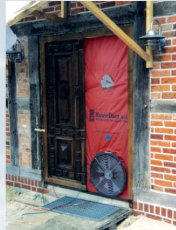
BlowerDoor-Messung im Rahmen einer Fachwerksanierung.

Von einem luftdichten Gebäude spricht man, wenn die Luft im Gebäude unter Prüfbedingungen nicht häufiger als drei Mal pro Stunde ausgetauscht wird. Wird eine Lüftungsanlage im Haus installiert, darf der Luftwechsel gem. Energieeinsparverordnung (EnEV 2002, Anhang 4 Nr. 2) bei Prüfdruck max. 1,5 m 3 pro Stunde betragen. „Luftdicht“ bedeutet dabei nicht das totale luftdichte Verschließen, sondern meint die Vermeidung ungewollter Leckagen in der Gebäudehülle. Denn: Warmluft strömt durch Fugen nach außen – das kostet Energie. Gleichzeitig transportiert die warme Luft Feuchtigkeit, die sich in der Außenwand des Gebäudes abkühlt und kondensiert; das entstehende Tauwasser kann zu schwerwiegenden Bauschäden führen. Dringt Außenluft durch Fugen ins Gebäudeinnere, werden zudem Allergene aus der Dämmung und Staubpartikel in das Haus transportiert; gesundheitliche Beeinträchtigungen können die Folge sein.